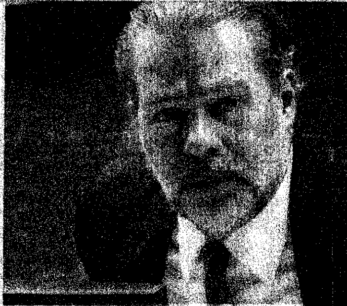
DIAS TOFFOLI elaborou as novas regras