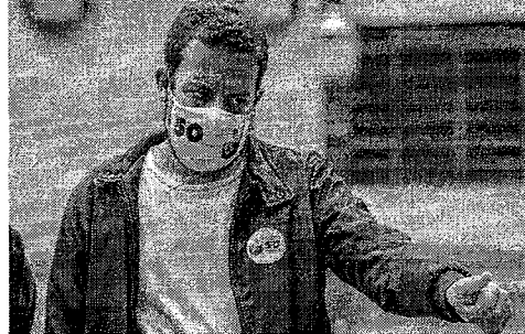
INTIMADO pela PF, Boulos terá que se apresentar na superintendência da PF em São Paulo no dia 29

Estado do Ceará - Prefeitura Municipal de Palmácia - Aviso de Chamada Pública Nº 01/2021 - CPM - Intimando a administração do licitante e o prazo de validade até o dia 15 de maio de 2021, no Pórtico Centro Administrativo de gestão compartilhada do Agrupamento Escolar e do Ensino Superior Família Rural, para a contratação de serviços de manutenção e conservação de instalações elétricas - FIME, na interesse da Gerência de Educação do Município de Palmácia-CE. Local da empresa de documentação e informações: Praça 7 de Setembro Nº 103, Centro, Palmácia-CE, de 08:00 às 17:00. Nova Itaipava Campos Gerais - Secretária de Educação.