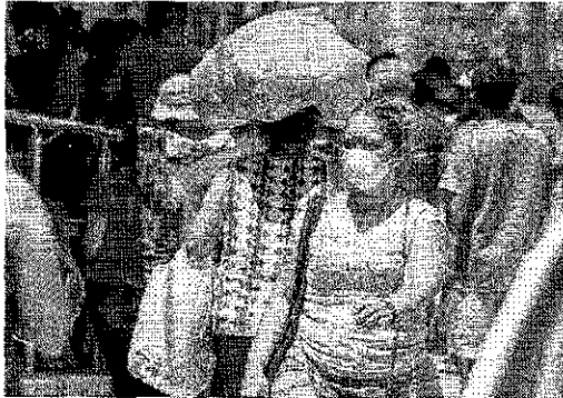
PARA 50% das famílias mais afetadas, a diminuição do valor do benefício será de até R$ 46, segundo números do próprio governo federal

Cerca de 5,4 milhões de beneficiários do Bolsa Família podem não ser contemplados pela promessa de aumento no valor do benefício e teriam até uma redução após a substituição do programa pelo Auxílio Brasil, segundo simulações do próprio governo federal obtidas pela Lei de Acesso à Informação (LAI). O número corresponde a 37% dos 14,7 milhões de atuais beneficiários da política social.