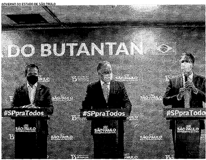
GOVERNADOR de São Paulo, João Dória; do Espírito Santo, Renato Casagrande; e do Ceará, Camilo Santana; na solenidade em São Paulo

Sindicato dos Empregados e Trabalhadores nas Instituições Religiosas, Beneficentes e Filantrópicas do Estado do Ceará - Edital de Contratação. O SINTIEREF-CE, sediada à Rua... #SPpraTodos