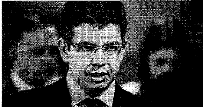
RANDOLFE Rodrigues, vice-presidente da Frente, também articula por uma nova CPI da Covid