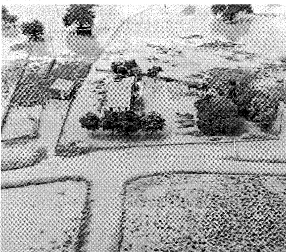
IMAGEM aérea da zona rural de Várzea Alegre após rompimento de barragem no sábado passado, 12

No Ceará, existem 89.698 barragens com comprimento igual ou maior que 20 metros, conforme levantamento realizado com técnicas de sensoriamento remoto e de geoprocessamento pela Fundação Cearense de Meteorologia e Recursos Hídricos (Funceme). Entretanto, apenas 695 estão devidamente registradas, o que representa menos de 1%. O número abrange reservatórios privados e públicos, incluindo os 155 açudes monitorados pela Companhia de Gestão dos Recursos Hídricos (Cogehr).