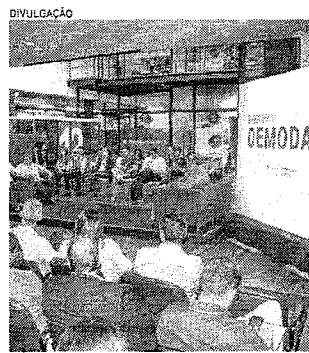
PROGRAMA do Governo em parceria com as empresas e universidades ajuda a impulsionar ecossistema de inovação no Ceará

DEMODAY | Com investimento de mais de R$ 2 milhões em startups cearenses, programa apresentou soluções de impacto direto às áreas estratégicas da economia do Ceará