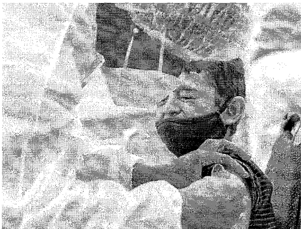
NO BRASIL, a faixa etária entre 5 e 11 anos começou a ser vacinada em janeiro

Terapias Avançadas (GGBIO), a vacina deve ser utilizada no esquema de duas doses com intervalo de 28 dias.