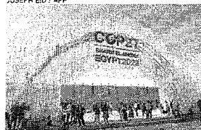
COP-27 começou no último domingo, no balneário egípcio de Sharm El Sheikh