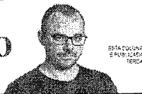
ESTACIÃO DE POLÍCIA TERÇA