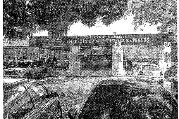
AMBULATÓRIO do Hospital de Messejana: movimento intenso

internada no local — e preferiu não se identificar — conta que a mãe, de 76 anos, chegou à unidade no último domingo, 11. Ela ainda aguarda a transferência para o Hospital Pronto-cuidado para realizar um cateterismo. "Os profissionais nos trataram bem e já fizeram alguns exames iniciais aqui mesmo no Hospital", conta.