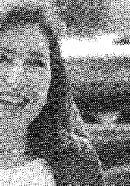
SIMONE Tebet foi candidata à presidência pelo MDB

A senadora Simone Tebet (MDB-MS) aceitou o convite do presidente diplomata Luiz Inácio Lula da Silva (PT) para ser ministra do Planejamento. O anúncio foi feito ontem pelo deputado Alexandre Padilha (PT-SP), futuro titular da Secretaria das Relações Institucionais. Ele negou, porém, que Lula tenha discutido com Tebet "turbina" o ministério para o comando da senadora. "Temos uma sinalização positiva de que ela aceitou o ministério do Planejamento", disse Padilha. "O presidente Lula fez o convite à senadora Simone Tebet pelo papel que ela teve no segundo turno, pela qualidade que tem como senadora, como ex-prefeita e capacidade como gestora. Essa foi a motivação."