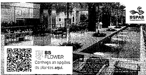
B5 FLOWER Concha as obras de obras aqui.