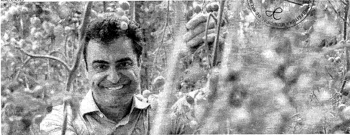
EMPRESA mira exportação para Europa