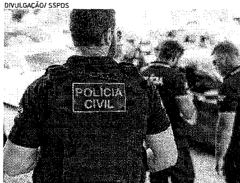
OPERAÇÃO Sarmat foi deflagrada pela Polícia Civil

A Polícia Civil do Ceará (PC-CE) deflagrou, na manhã de ontem a operação "Sarmat", com o intuito de combater um esquema de tráfico internacional de drogas. Além do cumprimento de 39 mandados de busca e apreensão, foram bloqueados cerca de R$ 20 milhões em contas e bens dos suspeitos. Aproximadamente, 10 automóveis foram apreendidos. Dois mandados de prisão preventiva ainda foram cumpridos e outras duas pessoas foram presas em flagrante em posse de drogas, munições e uma pistola.