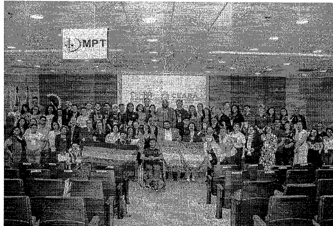
GRUPO reunirá instituições da esfera civil, pública e privada

KLEBER CARVALHO ESPECIAL PARA O POVO joan.kleber@opovo.com.br