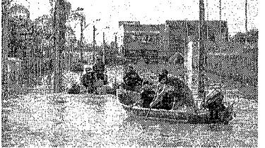
CALAMIDADE no Rio Grande do Sul