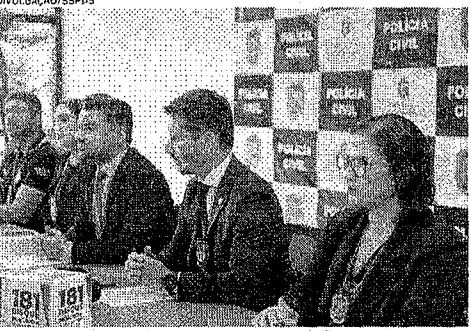
INFORMAÇÕES sobre a Operação Vertex foram repassadas em coletiva

Durante a operação foram apreendidos equipamentos eletrônicos, como notebooks e smartphones, assim como uma pistola calibre 380, com 70 munições e cinco carregadores. A operação foi deflagrada pelo Departamento de Polícia Judiciária Especializada (DPJE)