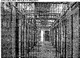
SAIDINHA de detentos das penitenciárias virou alvo dos legisladores