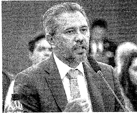
ELMANO articulou subsídio com a construção civil

O governador Elmano de Freitas (PT) emendou na noite de segunda-feira, 15, à Assembleia Legislativa mensagem que cria o programa Minha Moradia Ceará, que irá ampliar em até R$ 20 mil o subsídio concedido a imóveis adquiridos pelo programa Minha Casa Minha Vida (MCMV) no Estado.