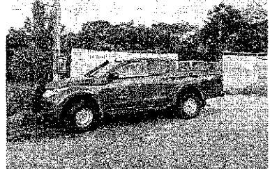
IBAMA embargou a obra na quarta-feira passado

Um coletivo de biólogos de Ceará lançou uma carta aberta para se manifestar sobre o planejamento do terreno onde será construída a nova Cidade Fortal. A obra foi embargada pelo Instituto Brasileiro do Meio Ambiente (Ibama) na quarta-feira passada (15), e passa por intermédio entre órgãos ambientais e a revitalização do evento. De acordo com o diretor do Fortal, não há outro local possível para a realização do evento.