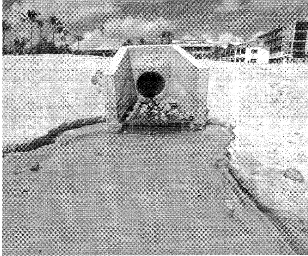
GALERIAS pluviais no encontro com o mar no Cumbuco, em Caucaia

esgoto e ficam com receio de entrar no mar.