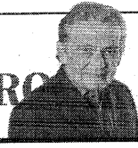
ESTA COLUNA É PUBLICADA DE SEGUNDA A DOMINGO

De Sêneca: Gostaríamos de dizer que não podemos escolher nossos pais, que eles nos foram dados pelo acaso.