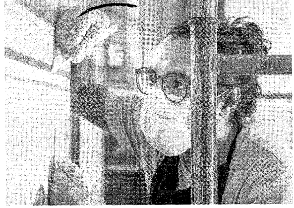
ALUNOS trabalham sob supervisão na restauração do salão

Com os olhos atentos, materiais em mãos e o cuidado em fazer um bom trabalho, os alunos do curso de conservação e restauração da Escola de Artes e Ofícios Thomaz Pompeu Sobrinho realizam o restauro do chamado salão azul do palacete histórico localizado no bairro Jacarecanga, em Fortaleza.