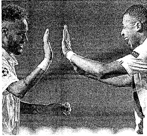
NEYMAR e Mbappe são esperança de gols do PSG contra o RB Leipzig