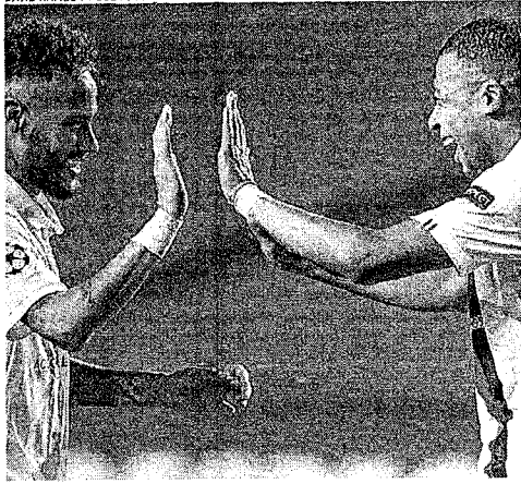
NEYMAR e Mbappe são esperança de gols do PSG contra o RB Leipzig

GABRIEL LOPES ESPECIAL PARA O OPVO gabriellopes@opovo.com.br