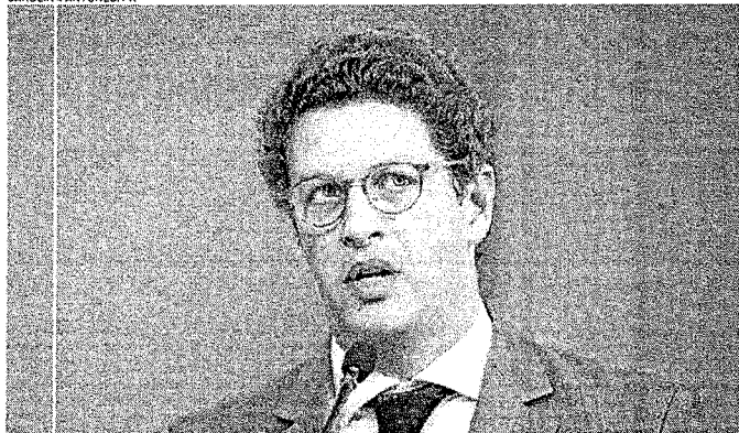
SALLES e o Governo Federal têm maior poder de controle sobre decisões do Conama