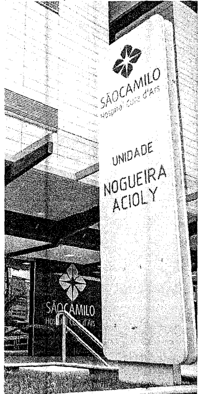
Na última segunda-feira, foram atendidos 133 pacientes com síndromes gripais no Hospital São Camilo