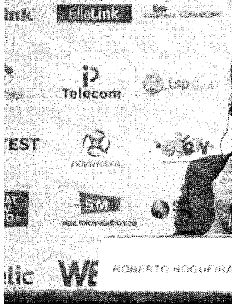
CEO da Brisanet ainda afirmou que início da operação está previsto para outubro

ARMANDO DE OLIVEIRA LIMA armando.lima@opovo.com.br