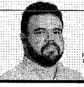
ESTA COLUNA É PUBLICADA SEMPRE À SEXTA-FEIRA