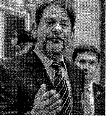
CID gosta de briga grande