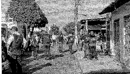
TRÍPLIO homicídio ocorreu em 23 de agosto de 2013

Constantino de Alencar, ocorrida um dia antes do triplo homicídio, em 22 de agosto de 2013, também na Vila Manoel Sátiro.